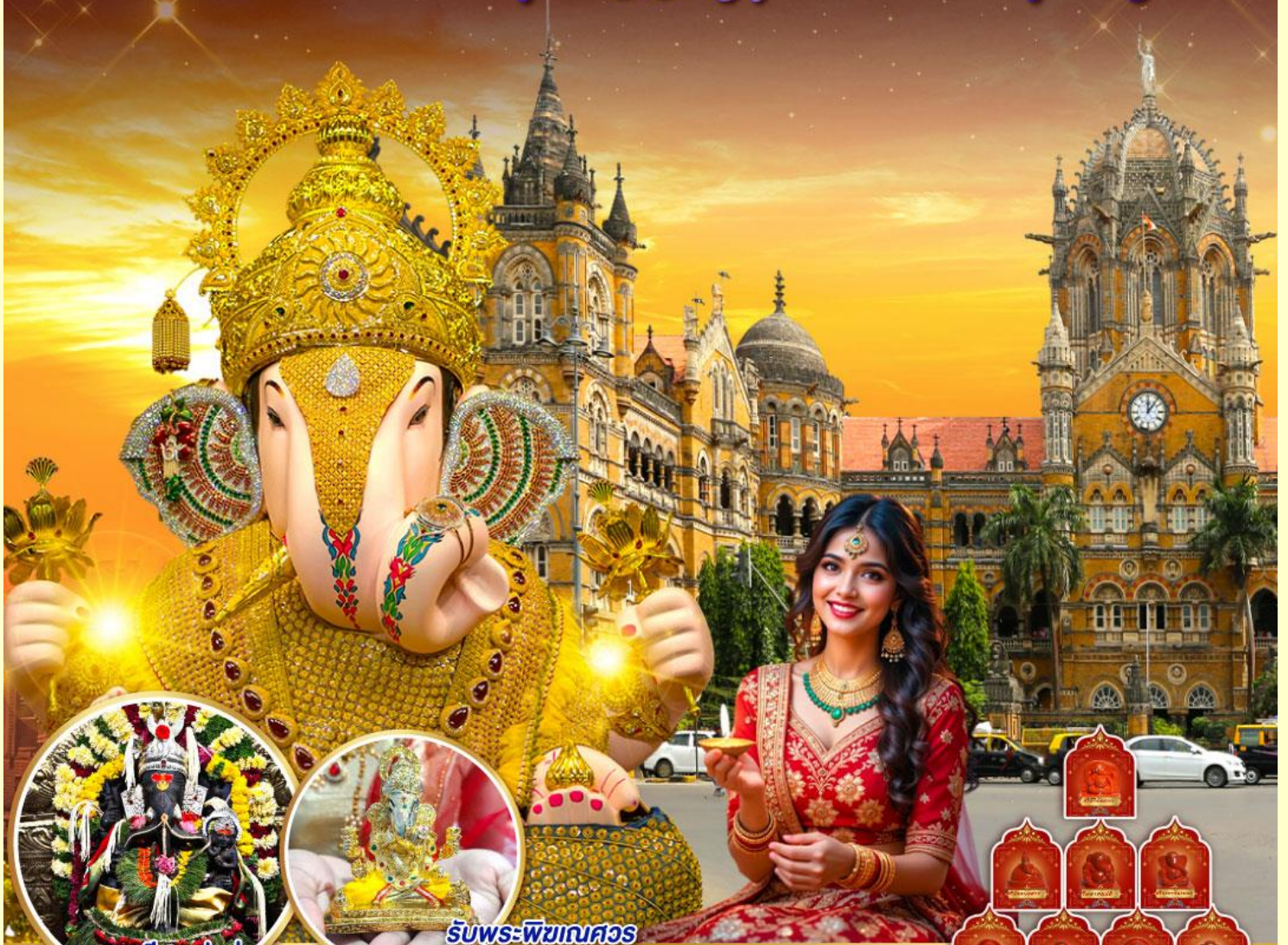
พระตรีศูล ปูเน่ (Trishul Pune)

เสริมชะตา จุดปัญญา มุสุมบิง มหานครมุมไบ ปูเน่