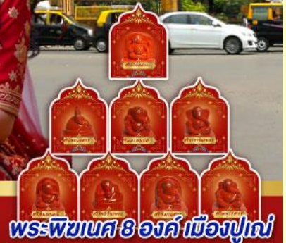
พระพิฆเนศ 8 องค์ เมืองปูเน่