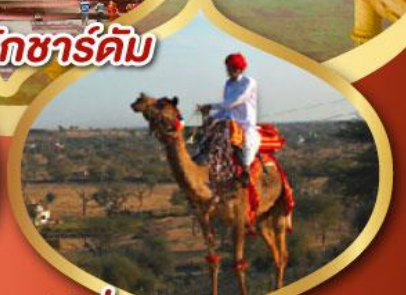
ฟรี ขี่อูฐ เมืองมันทวา ราคาเริ่มต้น