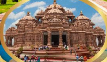
วิหารอักซาร์ดีม