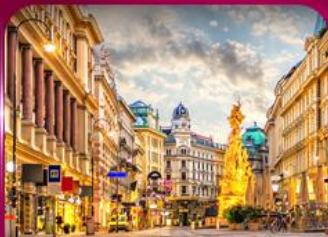
ชมเมืองโรมันติก เวียนนา