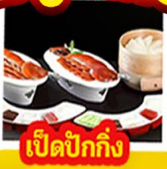
เปิดปีกกึ่ง