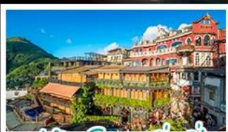
หมู่บ้านโบราณจัวเฟิ่น