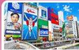
ชิบูย่าชิ