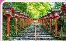
ศาลเจ้าคิฟูเนะ