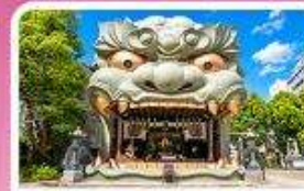
ศาลเจ้านิมมะ ยาซากะ