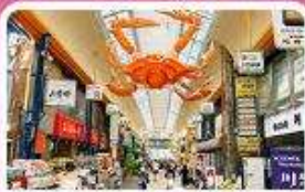
ตลาดคุโรมาง

เดินทาง 19 - 23 ส.ค. 69 | 25 - 29 ก.ย. 69