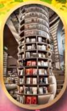
อุทยานปีศาจโกว