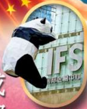
IFS หมีแพนด้าป็นดัก