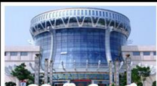
พิพิธภัณฑ์ทิวาสี

สวนสนุก FANTASYLAND - หมู่บ้านสไตล์ยุโรป พิพิธภัณฑ์ทิวาสี - ถนนคนเดินสามตรอกสองซอย ท่าเรือกิ่งจื่อ - ศาลเจ้าแม่กวนอิมพันกร เมนูพิเศษ อาหารทิวาสี , สุกีชาบูหม่าล่า