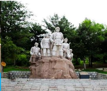
อนุสาวรีย์พิงหวง