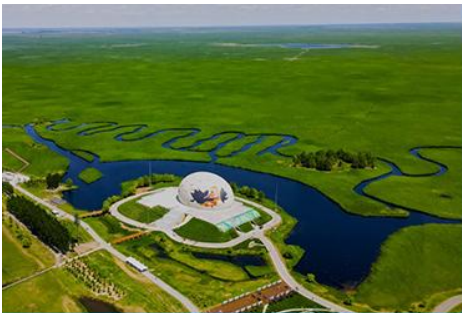
อุทยานชุ่มชื้นจาหลง

รับประทานอาหารเช้า ณ ห้องอาหารของโรงแรม (7)