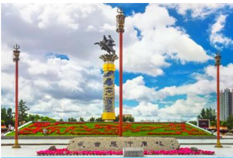
จัตุรัสวงกิสข่าน

หลังอาหารนำท่านเดินทางสู่เมือง ไห่ลาเอ๋อ 海拉尔市 (ระยะทาง 456 กม. ใช้เวลาเดินทางราว 5 ชั่วโมงครึ่ง)