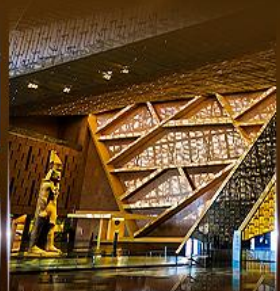
พิพิธภัณฑ์แกรนด์อียิปต์ (GEM)