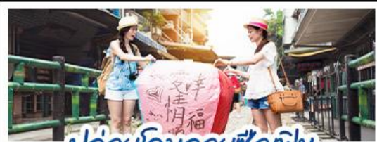
ปลั๊อโคมลอยซือเฟิน