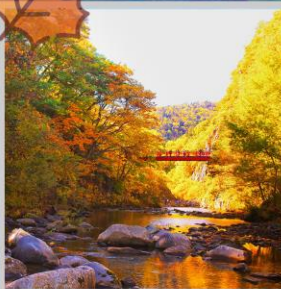
“JOZANKEI FUTAMI BRIDGE”