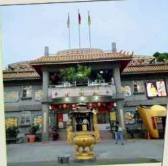
วัดจินซาน (โซคลาก)