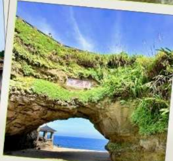
ถ้ำสี่หมื่น