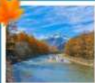
คามิโกจิ