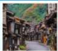
หมู่บ้านโบราณมาราชิ จุกุ