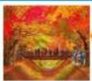
อุโมงค์เมนิค