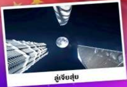
สูงเจ็ยสูย