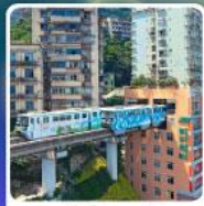
รถไฟฟ้า-สุตึก