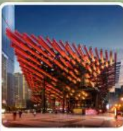
พิพิธภัณฑ์ศิลปะ-ตะเกียบ