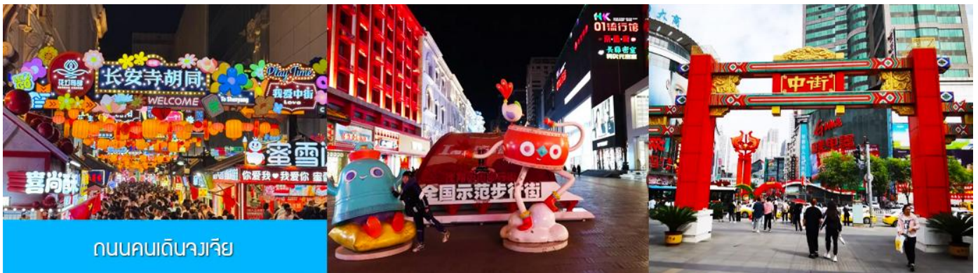
ถนนคนเดินจางเจีย

จากนั้นนำท่านเดินทางสู่ เมืองเสิ่นหยาง 沈阳市