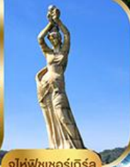
จูไห่ฟิชชอร์ทิวรา