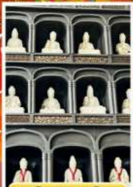
วัดไดชิซังเซอิไดจิ