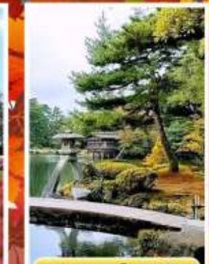
สวนเคนโระคุเอ็น