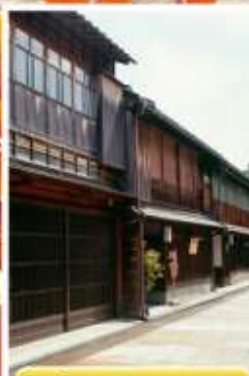
ย่านอิงาชิบายะ