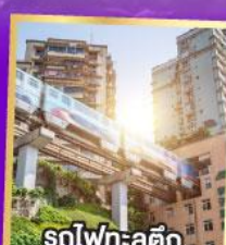
รถไฟฟ้า: ลูตึก