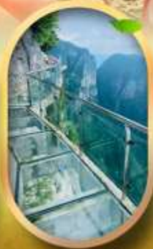
ทางเดินกระจกฉิมผา