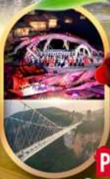
OPTION 1 : ไร่มังกรพญางิ้วจอกขาว OPTION 2 : สะพานแก้วจางเจียเจีย