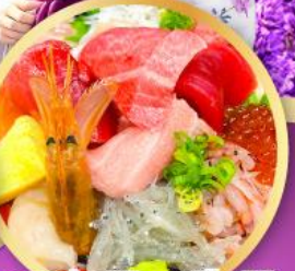
ตลาดปลาฮิมิสู คาชิโนะจิ

ถ่ายรูปเชคอินวิวฟูจิ กับซุ้มประตูโทเซคิจิ แซนมอน