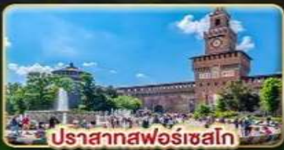
ปราสาทฟอโรเซโก

📅 เดินทาง : 28 พ.ค. - 06 มิ.ย. | 05-14 ส.ค. 15-24 ต.ค. 69