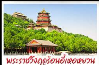
พระราชวังฤดูร้อนอ้าหอยวน

ท่าแพงเมืองจินด่านจวียงกวน - พระราชวังฤดูร้อนอ้าหอยวน สวนจิ้งอัน - วัดลามะ - โมเดลร้านช้อปปิ้ง - โรงแรม 4 ดาว มือพิเศษ เปิดปิกกิ้ง สุกิมองโกล MICHELIN GUIDE ร้าน TAO TAO JU