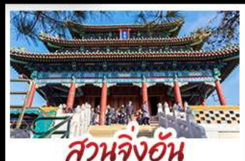
สวนจิ้งอัน