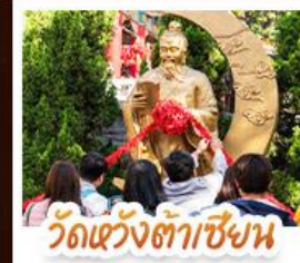
วัดแฉงต้าซิงหน