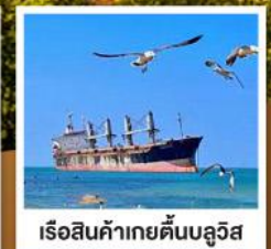
เรือสินค้าเกย์ตันบลูวิส