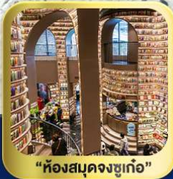
“ห้องสมุดจงซูเก๋อ”