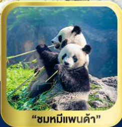
“ชมหมีแพนด้า”