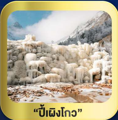
“ปี้เฉิงโกว”

นั่งกระเช้าชมวิว ภูเขาหิมะ-ต้ากู่กลาเซียร์ • ชมความสวยงาม ณ อุทยานปี้เฉิงโกว ห้องสมุดจงซูเก๋อ • ศูนย์หมีแพนด้า • ตงเจียวจี้ • ซอยกว้างชวยเคบ