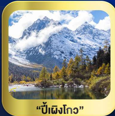
“ปี้เฉิงโกว”