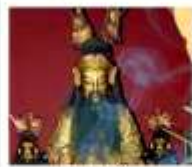
เชียงใหม่