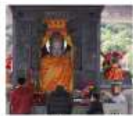
ไถ่ทองคำ