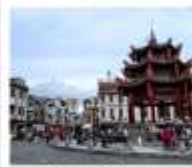
เมืองเก่าซีเตา