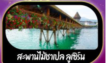
สะพานไม้ฆาปค คูซีน