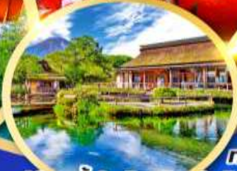
หมู่บ้านน้ำใสโอชิโนะฮักโกะ