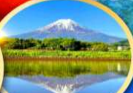
ทะเลสาบคาวากูจิโกะ