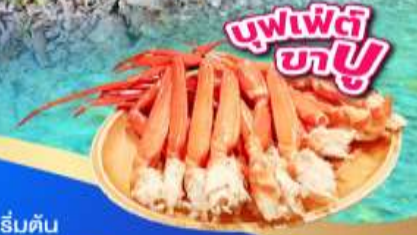
บุฟเฟ่ต์ ขาปู