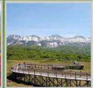
"SHIRETOKO 5 LAKES"