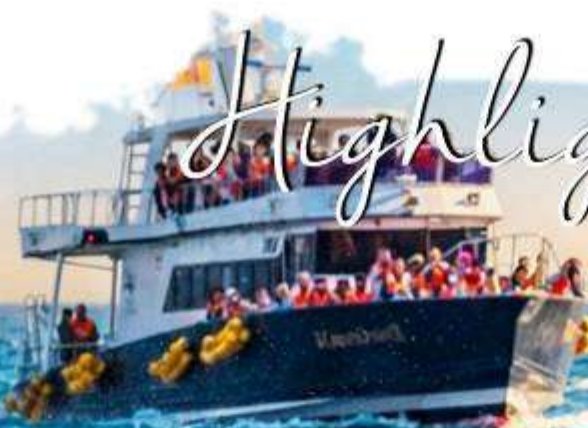
RAUSU WHALE CRUISE