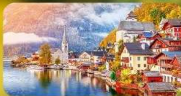
การ์นต์พัก Hallstatt / St. Wolfgang หรือริมทะเลสาบ 1 คืน