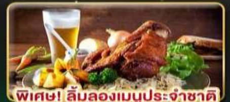
พิเศษ! ลิ้มลองเมนูประจำชาติ ถึง 5 ประเทศ!!