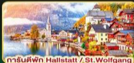
การันตีพิก Hallstatt / St. Wolfgang หรือริบทะเลสาบ 1 คืน