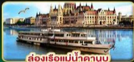
ล่องเรือแม่น้ำดานูบ พร้อมจับแซลมอน