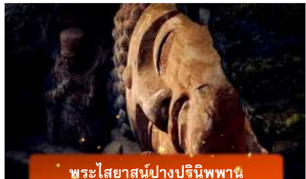
พระไสยาสน์ปางปรินิพพาน