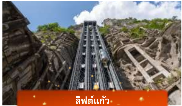
ลิฟต์แก้ว