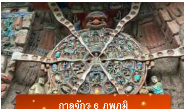
กาลจักร 6 ภพภูมิ

หลังจากนั้นนำท่านเดินทางกลับ เมืองฉงชิ่ง