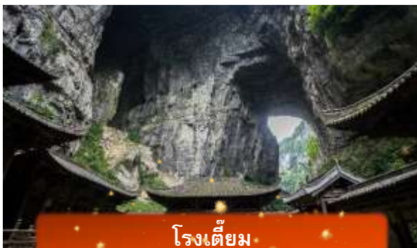
โรงเตี๊ยม

นำท่านลง ลิฟต์แก้ว สู่หุบเหวลึก 80 เมตร ชมกลุ่มสะพานสวรรค์ – สะพานหินธรรมชาติใหญ่ที่สุดในเอเชีย 3 แห่ง ได้แก่ สะพานมังกรสวรรค์ มังกรเฉียว และมังกรดำ ท่ามกลางธรรมชาติสุดอลังการ พร้อมแวะโรงเตี๊ยมโบราณฉากจริงจากภาพยนตร์ “ศึกโค่นบัลลังก์วังทอง” รวมค่าลิฟท์ 1 เที่ยว