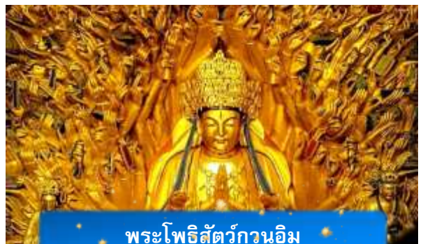
พระโพธิสัตว์กวนอิม

นำท่านเดินทางสู่ มรดกโลกอุทยานผาหินแกะสลักต้าจู่ ศิลปะหินแกะสลักอันล้ำค่าแห่งเมืองฉงชิ่งมรดกโลกที่องค์การยูเนสโกขึ้นทะเบียนเมื่อปี ค.ศ. 1999 ตั้งอยู่ทางตะวันตกของนครฉงชิ่ง ประเทศจีน ศิลปะหินแกะสลักเหล่านี้สร้างขึ้นตั้งแต่ราชวงศ์ถังจนถึงราชวงศ์ซ่ง มีอายุมากกว่า 1,000 ปี โดดเด่นด้วยงานแกะสลักทางพุทธศาสนาที่งดงามและยังคงสภาพสมบูรณ์ (ใช้เวลาเดินทางประมาณ 1-2 ชั่วโมง)