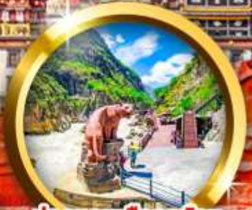
ขี่องแคบเสือกระโจน