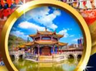
วัดหยวนทอง