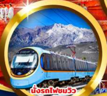
นั่งรถไฟชมวิวกูเข่าหิมะมังกรหยก