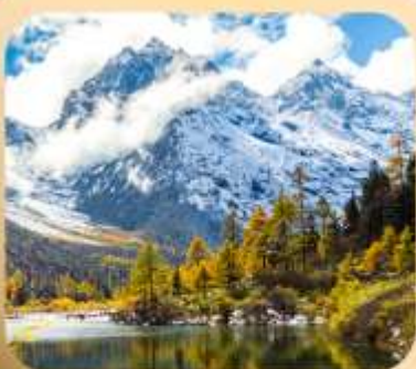
“ปี่ผิงโกว”

ชมธรรมชาติ 2 อุทยานขึ้นชื่อ อุทยานภูเขาสี่ดรุณี + อุทยานปี่ผิงโกว สะพานหนานเฉียว • ถนนคนเดินไถ่กู่หลี่ + ซุนซีลู่ + Pop Mart • ดงเจียวจื่อ