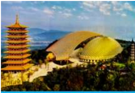
อุทยานหนิวโล่วซาน