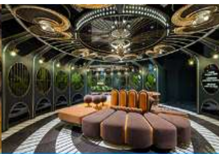
ห้องน้ำไอเทค