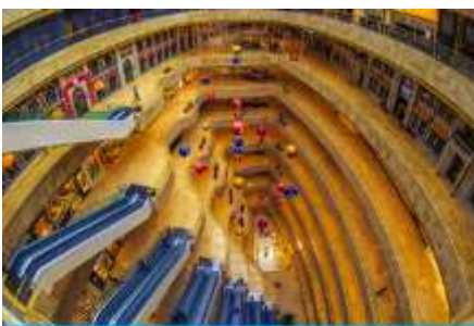
จัตุรัสเต๋อจี

พักที่ โรงแรม Holiday Inn Express Dongshan Hotel 4* หรือเทียบเท่าในนครหนานจิง