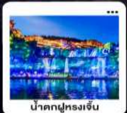
น้ำตกฟูหลงเจิน

"มหัศจรรย์...จางเจียเจีย" | ดินแดนแห่งขุนเขาและสายน้ำ "เขาเทียนเหมินซาน" | ประตูสวรรค์...ทำทวยศรึกษา 999 ชั้น | บั้งรถไฟความเร็วสูง สัมผัสความสวยงามระเบียบแกว "อุทยานอวตาร" | ส่องลอยกลางขุนเขา...ดั่งภาพฝันในห้วงนเจียเจีย | ช็อปปัง POPMART "เมืองโบราณ" ฟูหลง" หยุตเวลา ณ เมืองบนบ้านน้ำตก... | "เฟิ่งหวง" ส่องเรือชมชีวิตริมแม่น้ำถิวเจียง "นครฉางซา" ปิดท้ายความทันสมัย