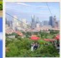
กระเช้าชมเมือง