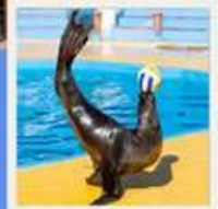
POLAR OCEAN PARK