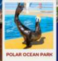
POLAR OCEAN PARK