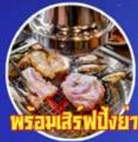
พร้อมเสิร์ฟปิ้งย่างเกาหลี