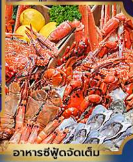
อาหารซีฟู้ดจัดเต็ม

บุฟเฟต์เบียร์ไม่อื่น + ซีฟู้ด + ปิ้งย่างเกาหลี