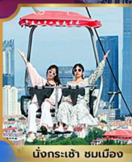
นั่งกระเช้า ชมเมือง