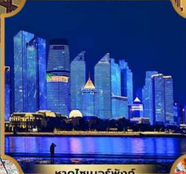
หาดโซเบอร์ฟังก์