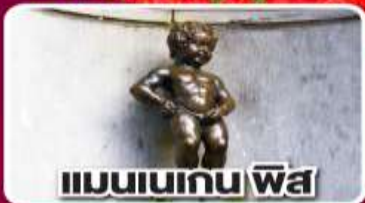
แมนเนเกน ฟิส